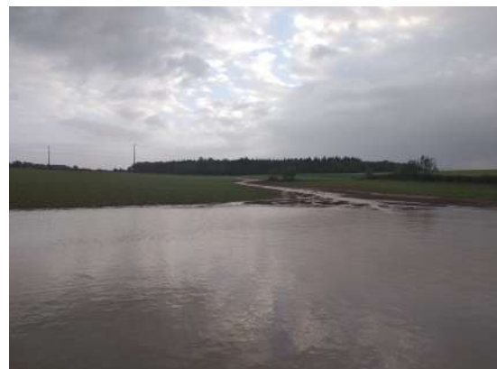
Chemin des Rouails

Tous ces litiges peuvent être réglés à l'amiable si chacun met dans son vin...de l'eau !